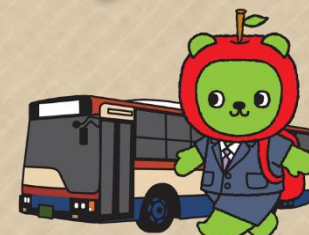
長野県PRキャラクター「アルクマ」/信南交通コラボ