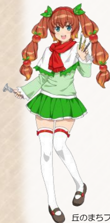
丘のまちフェスティバル マスコットキャラクター 「ナミギちゃん」