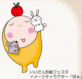
いいだ人形劇フェスタ イメージキャラクター「ほお」