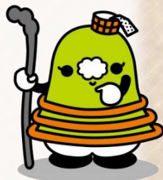
遠山郷観光大使 「とおや丸」